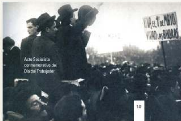
Acto Socialista conmemorativo del Día del Trabajador