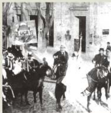
Manifestación opositora radical.

En realidad el ataque contra la tradición local volverá a tener un nuevo "round" años después, cuando en 1.906 con motivo del fallecimiento del Bartolomé Mitre, el "municipal" Abelardo Álvarez proponga como homenaje al ex-Presidente Nacional cambiar el nombre de calle San Isidro por el de "Avenida Bartolomé Mitre". Tal moción contará con el fuerte rechazo de los municipales Peregrino Román y Diógenes Recuerdo, quienes proponen no lesionar los sentimientos religiosos de los muchos fieles seguidores de San Isidro.