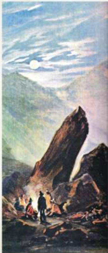
Punta de Yacas, en Mendoza Óleo de Rugendas

Para derrotar "la revolución de los colorados" el gobierno nacional envía al Gral. Wenceslao Paunero, quien derrota a los revolucionarios federales en la Batalla de San Ignacio y repone en el cargo a Melitón Arroyo. Se inicia así, un nuevo período en la historia mendocina y rivadaviense, caracterizado por los gobiernos liberales o "gobiernos de familias". Marcará una dura derrota para el "estrellismo".