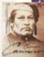
La "Conquista del Desierto" en estampillas.