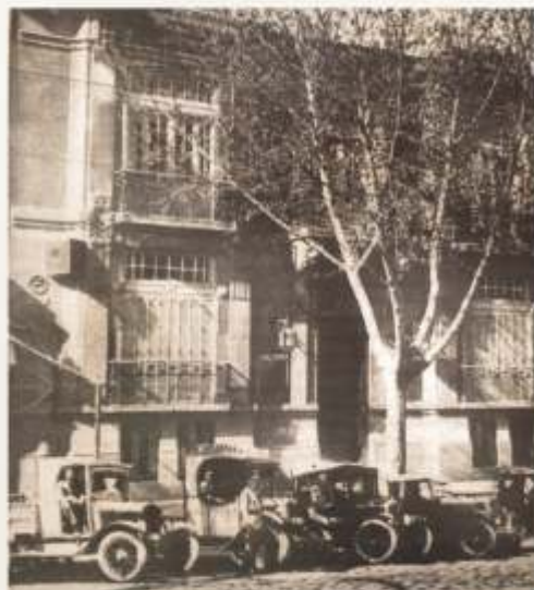
Diario Los Andes Década de 1910