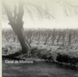
Canal de Medrano