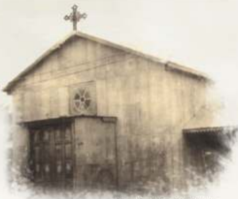
Antiguo Templo San Isidro Labrador.

El 18 de abril se consolida el anhelado propósito de concretar una administración independiente. Y si bien, la presión social no logró sostener el emblemático y arraigado nombre de San Isidro, parte de la tarea estaba cumplida.