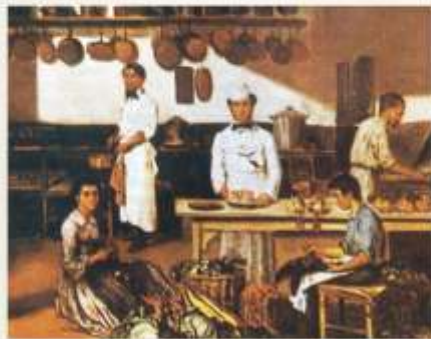
Cocina del Centenario

Su hija enamorada, y a punto de casarse con un italiano llegado a San Isidro, organizó una amplia reunión familiar, sorprendiendo al futuro yerno extranjero con la comida típica de su tierra natal: los famosos tallarines. Semejante acierto no hizo más que agudizar la visión comercial del viejo almacenero, quien desde ese momento anexó a su negocio la fabricación de pastas. (G.E.C. "Las Historias...")