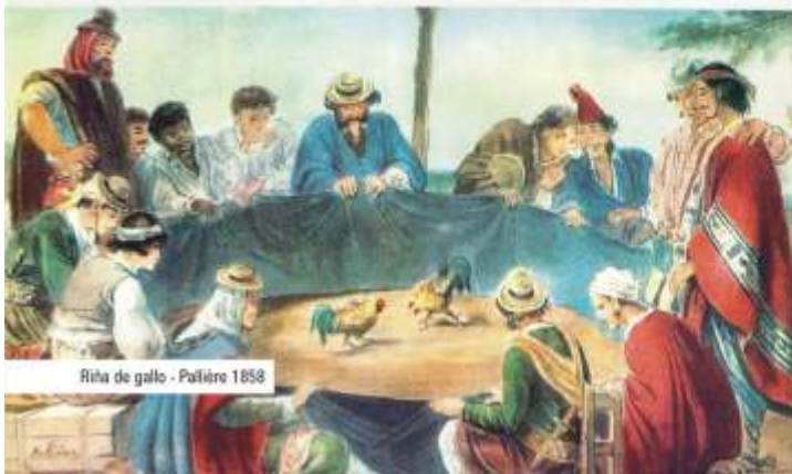
Riña de gallo - Poliétre 1858

Auspicio y Promoción Municipalidad de Rivadavia Concejo Deliberante de Rivadavia